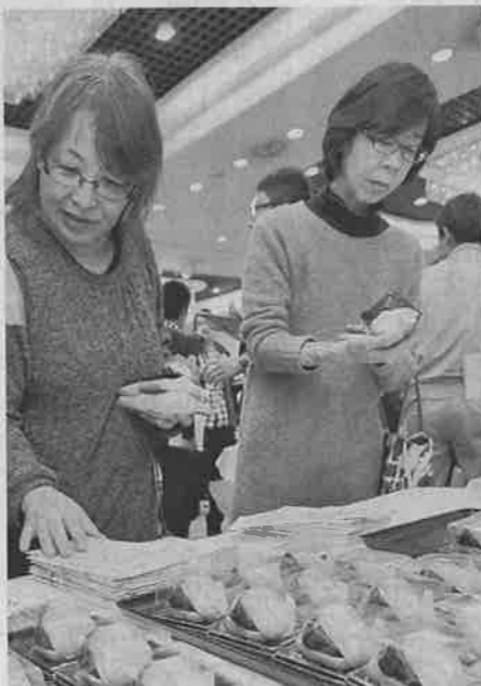
十勝産小豆を使った和菓子を試食する生